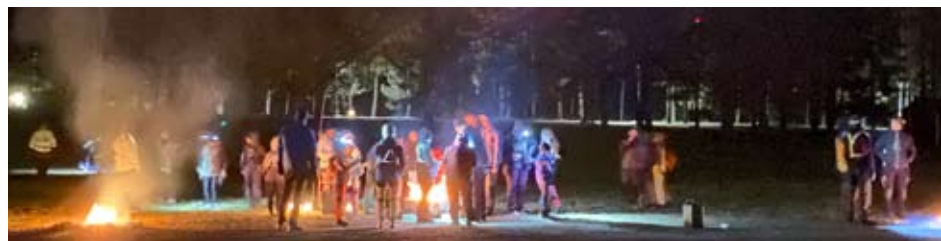
Scouterna på "Hundra meter eld" i Malmköping.