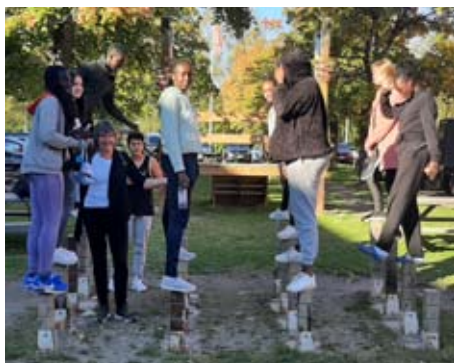
Konfahajk på Boda Borg