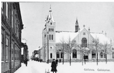
Förra S:t Eskilskyrkan låg i centrum..

Söndagen 31 maj kl 17 är det dax för ALL-SÅNGSKONSERT! Kom och lyssna & sjung tillsammans med kyrkans körer Co-razon, Soul Teens och Pre Soul Children!!